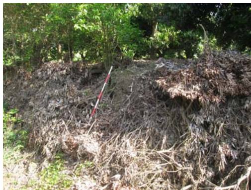
圖說：階崖斷面上露出的文化層斷面