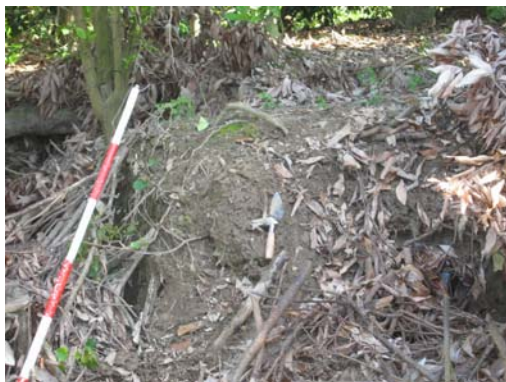
圖說：文化層內夾雜夾砂陶片